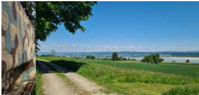
Text: Der Vorstand

Mit der Strategie soll der Vereinszweck nachhaltig gesichert werden.